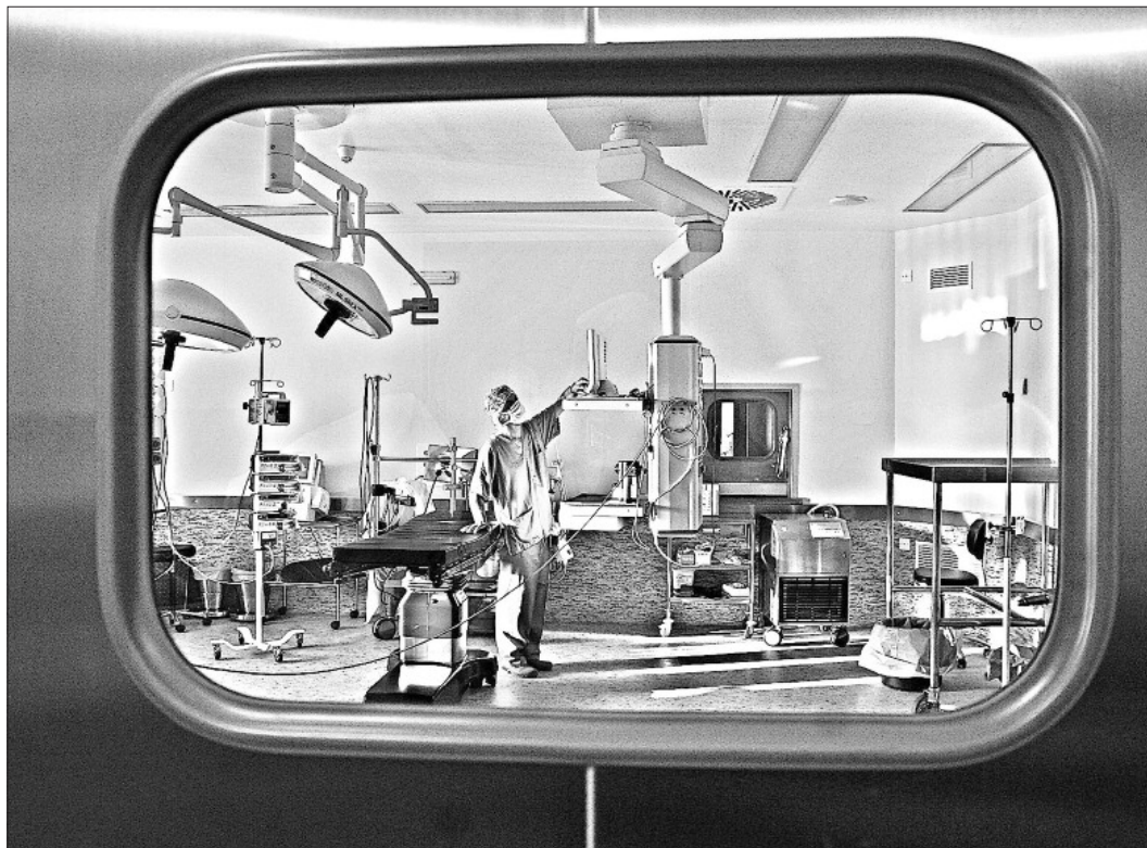
Vista parcial de un quirófano del hospital de Son Dureta, en Palma de Mallorca.

Las comunidades autónomas acumularon deudas pendientes de contabilizar que en el año 2003 ascendían a 6.036 millones de euros